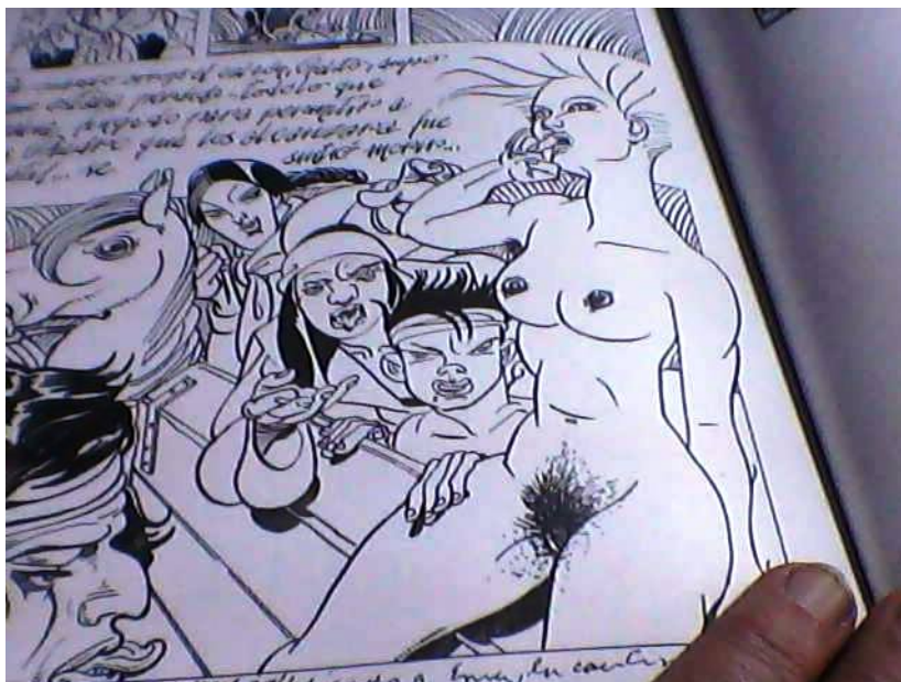
Imagen fotografiada del libro "El inspector justo y otras historietas", de editorial Colihue.