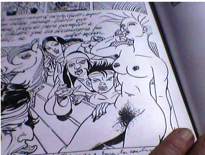
Imagen fotografiada del libro "El inspector justo y otras historietas", de editorial Colihue.